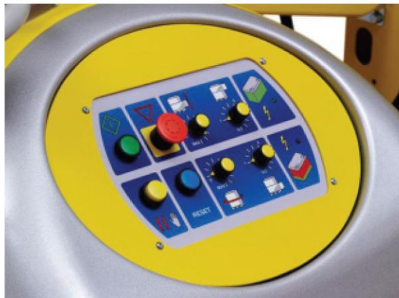
Panel potencjometryczny SFERA Easy