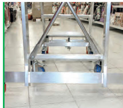
Masywny stabilizator. Massive stabilizer.