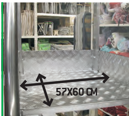
Obszerny podest zabezpieczony burtami. Large platform protected sidewalls.