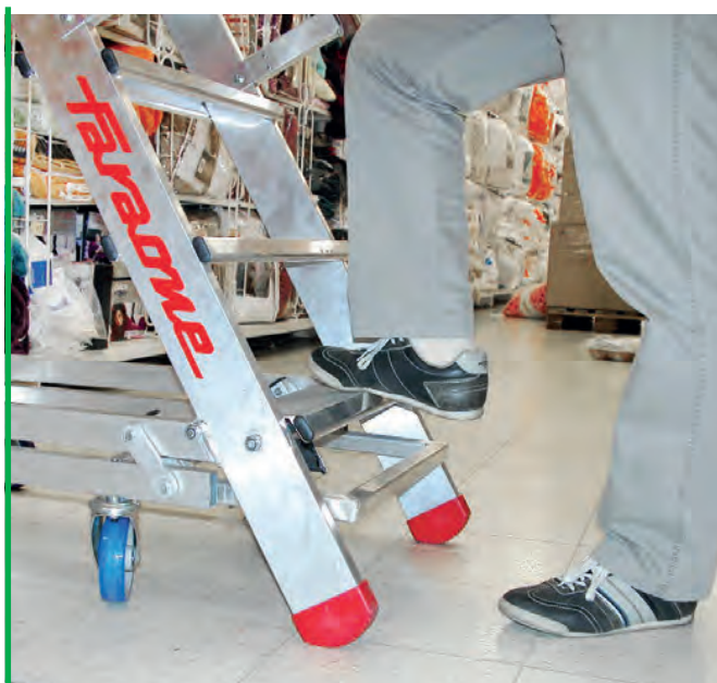
System automatycznej blokady platformy. The automatic locking platform.