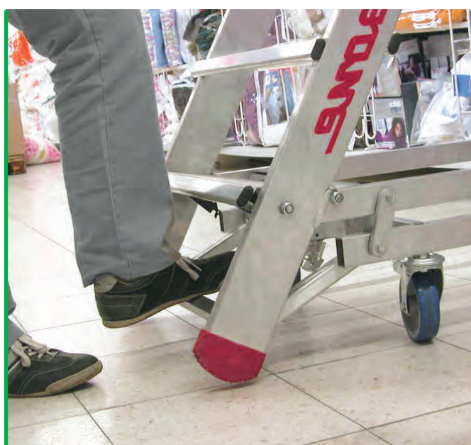
Zwalnianie blokady. Realising the lock.